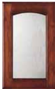
vetro acidato glass door